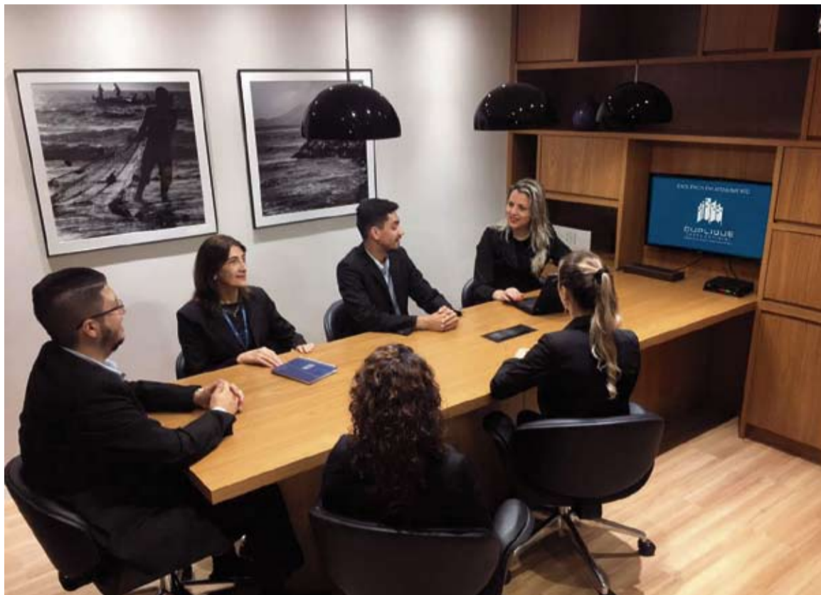
Sala de reunião Duplique Florianópolis

Para facilitar a contratação dos seus serviços, seu departamento comercial está sempre disposto a auxiliar, orientar e comparecer às assembleias condominiais, esclarecendo dúvidas e apresentando soluções para o eterno problema de inadimplência existente no condomínio.