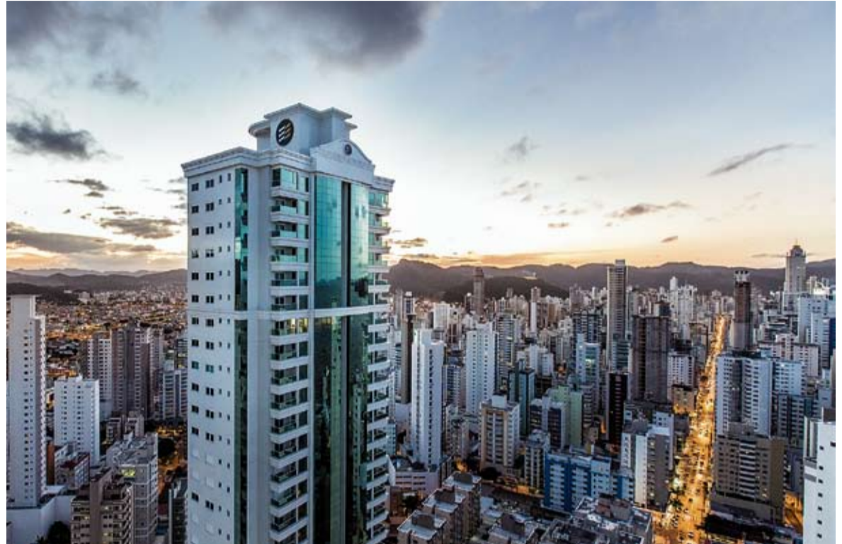
Em Balneário Camboriú, mais de 80% dos novos empreendimentos são de alto padrão e os preços variam de R$ 1 milhão a R$ 3,5 milhões

"Realizamos pesquisas de mercado imobiliário em diversas cidades e regiões do país e não encontramos nada igual. Praticamente a cidade virou uma opção de segunda moradia para pessoas no sul do país", complementa.