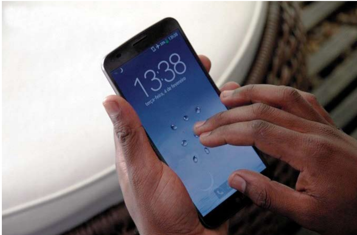
O síndico ou o regimento interno do condomínio podem proibir o uso do celular no horário de trabalho

“Ele não pode ser impedido de atender o celular em uma ligação