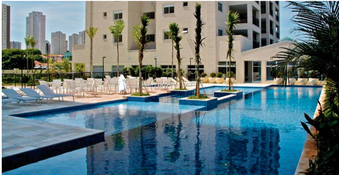
As piscinas agregam valor ao imóvel e trazem uma boa opção de lazer para os moradores

Um dos modelos que tem recebido grande aceitação do públi-