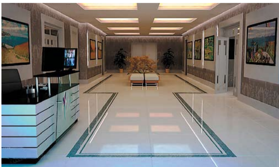
Hall de entrada: prezar o bom gosto, sem cair nas tentações do exagero ou da impessoalidade em excesso

mum a procura de condomínios para a decoração do hall de entrada e é possível alcançar bons resultados mesmo com o orçamento mais apertado. “Procuramos dar um bom impacto e neutralizar os materiais, explodindo com obras de arte. Não uso tendências, mas sim os materiais atuais, os tecidos, as luminárias, em que o led é bastante utilizado. O importante é dar um ‘up’ na chegada, fazendo com que a pessoa que entra se surpreenda”, comenta o arquiteto.