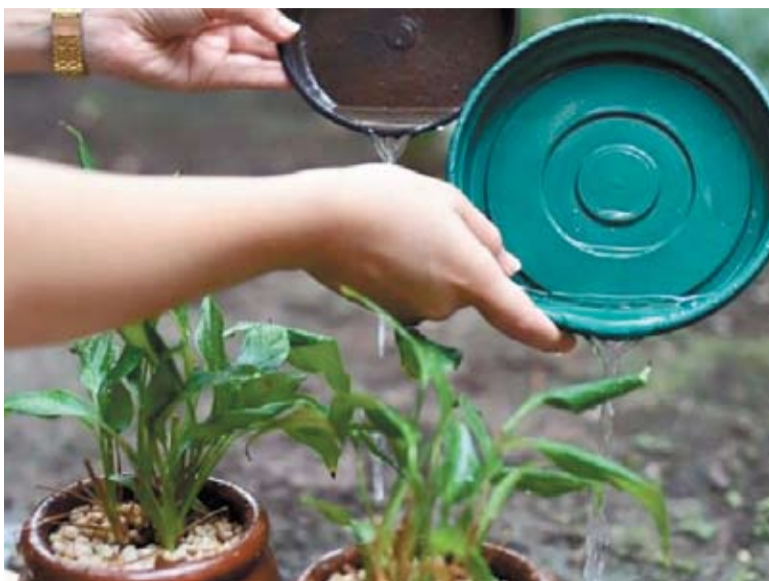
Para evitar focos do Aedes em condomínios é preciso atenção constante de síndicos e moradores

Em paralelo, o poder público deve vistoriar todos os tipos de imóveis em busca de focos do mosquito, mas em cidades como Balneário e Itapema, esse trabalho é prejudicado pelo grande número