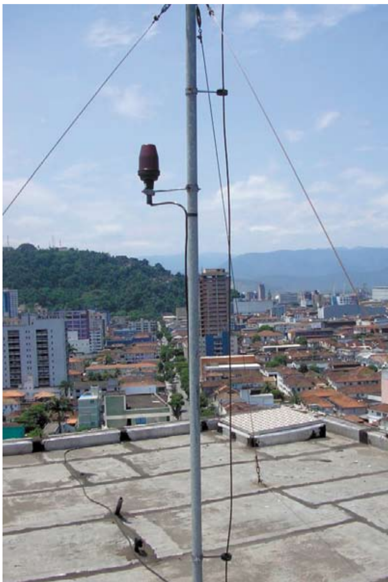
Sem o SPDA em dia o condomínio não recebe o atestado de funcionamento e está sujeito a sanções administrativas

Manutenções garantem a segurança de todos e evitam multas