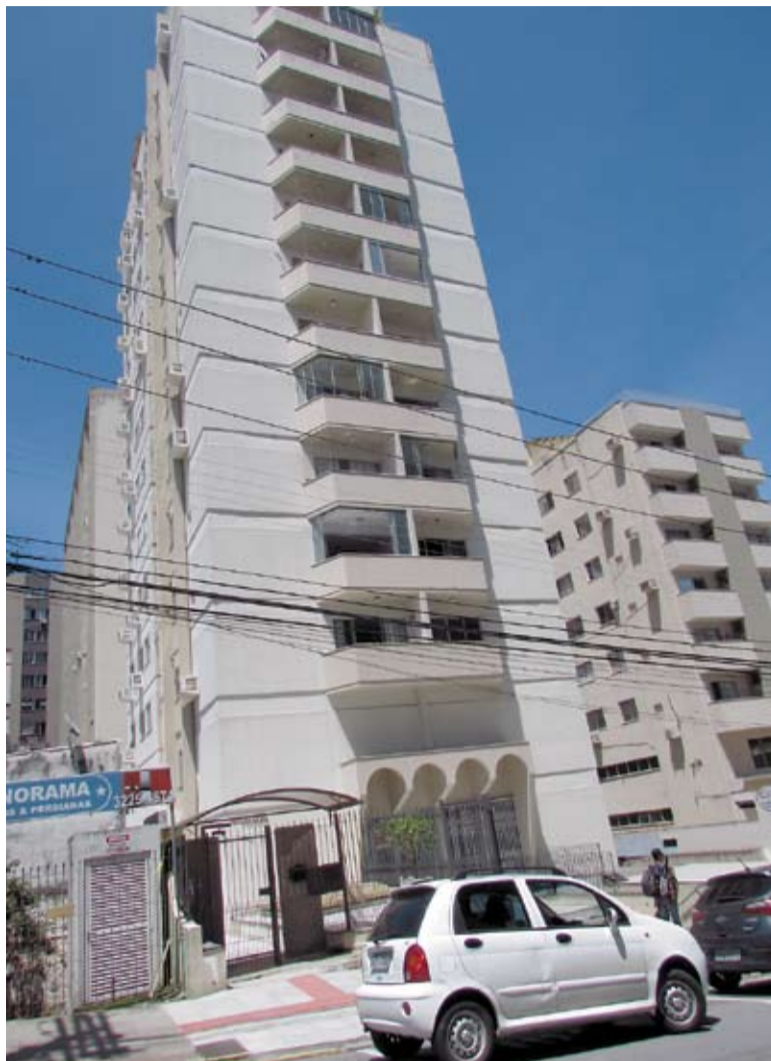
Condomínio Solar do Araguaia, no Centro de Florianópolis

“Com a escolha, deve ser feito o contrato de prestação de serviços com base no que foi ajustado. Apenas após a assinatura do contrato é que a obra deverá ter início. E, dependendo da natureza dessa obra, o condomínio ainda poderá