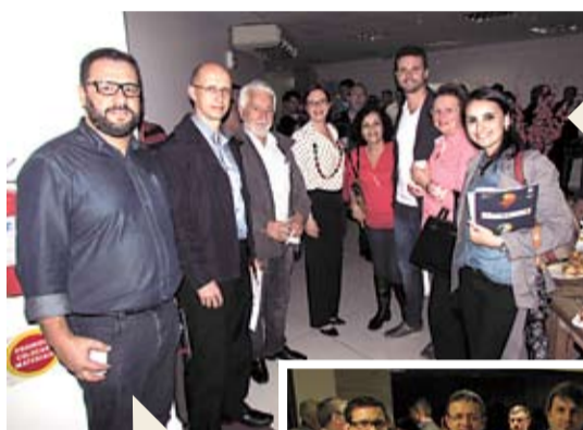
O evento contou com mais de 120 gestores e profissionais ligados ao setor de condomínios