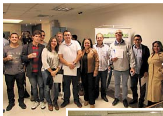
A exposição abordou os pontos vulneráveis da rotina condominial e sugeriu aos síndicos a criação de uma comissão de segurança composta por moradores para analisar e fiscalizar a segurança do condomínio