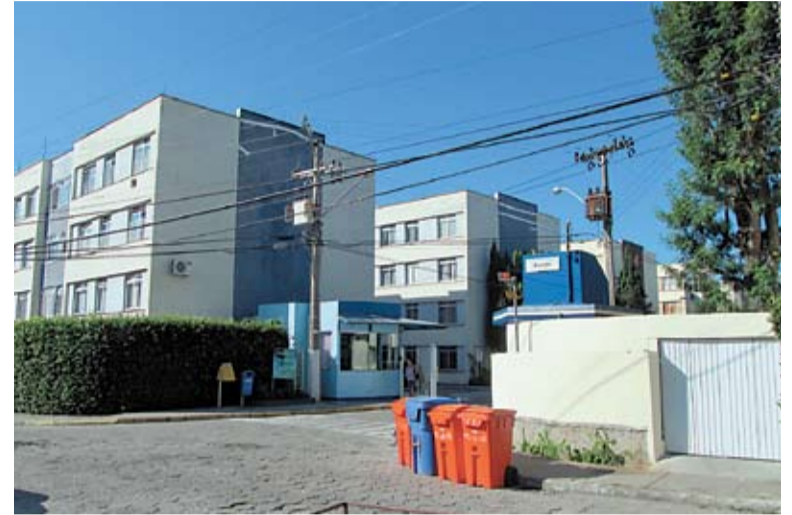
O condomínio Itambé criou um sistema de rodízio de vagas para atender os moradores dos 27 blocos

No condomínio Itambé, na Trindade, se utilizam as duas formas de rotatividade juntas. Segundo a