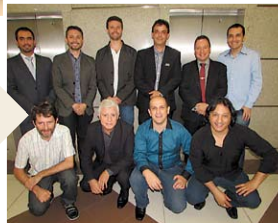
A palestra foi organizada pela SCOND - Software Online de Gestão para Condomínios e contou com o apoio das empresas Exato Condomínios e Contabilidade, Grupo Adservi, Duplique Santa Catarina e Jornal dos Condomínios