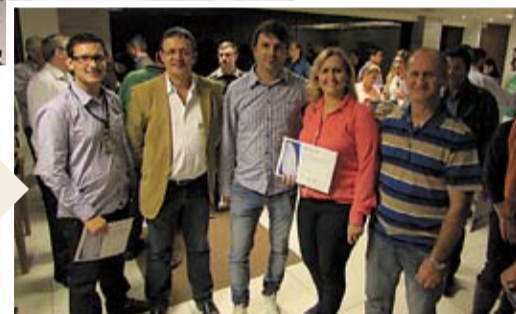
Síndicos de Joinville, Brusque e Balneário Camboriú também prestigiaram o encontro e receberam certificado de participação