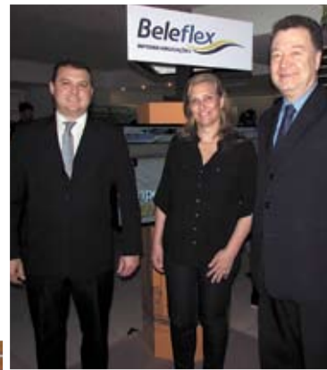
Presentes também no congresso profissionais e empresas do setor de condomínios

O tema segurança também esteve presente em palestra dirigida a síndicos da Grande Florianópolis em outubro. Com realização da SCOND Sistema de Gestão Online para condomínios o evento contou com mais de 120 gestores e recebeu o apoio do Jornal dos Condomínios e empresas do setor. Nesta edição ainda, saiba que a Norma NBR 16.280 da ABNT, que trata da gestão de reformas em edificações, pas-