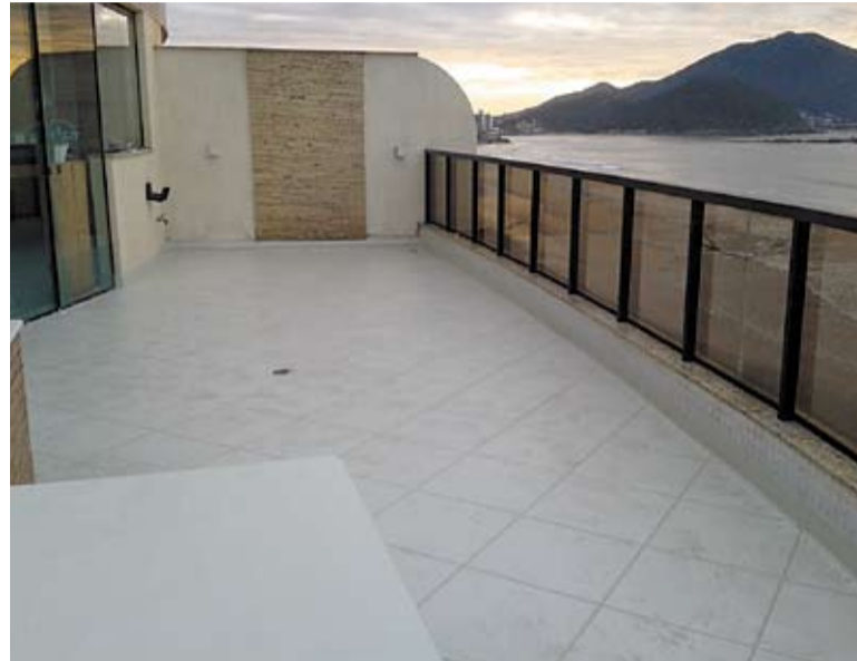
Cobertura no Residencial Ilha de Capri, em Navegantes: o morador levou dois anos para solucionar os problemas de infiltrações no imóvel