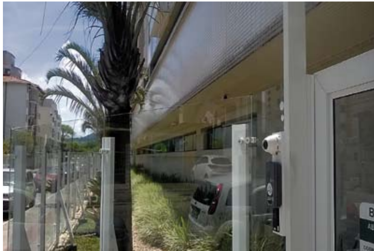
Portaria remota: a tecnologia consiste na substituição dos funcionários por um conjunto de equipamentos que são monitorados por profissionais especializados

Veras foi o responsável pela implantação da portaria remota em seu prédio, em outubro de 2016. O engenheiro deixou o car-