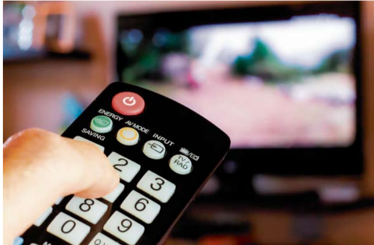
O sinal analógico de televisão tem dias contados na Grande Florianópolis

Pensando nisso, a RBS TV, o Secovi Florianópolis e o Jornal dos Condomínios firmaram uma parceria para difundir informações sobre o tema. A intenção é contri-