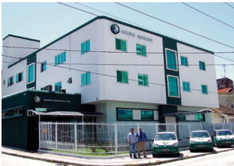
O Grupo Adservi expande sua atuação para a cidade de Itajaí