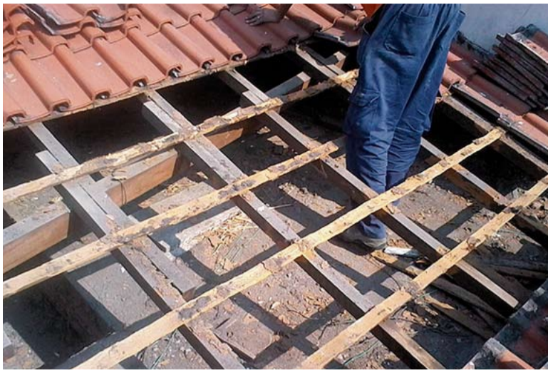
Infestação em telhados ou estruturas de contenção traz prejuízo para os condomínios